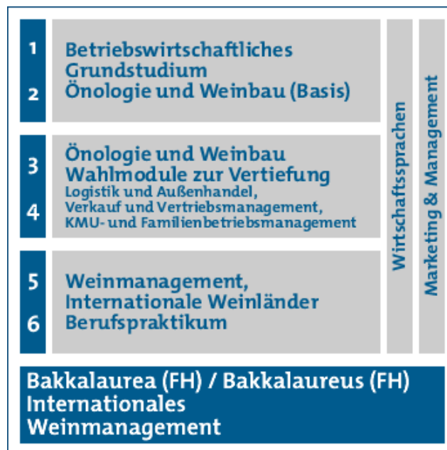
Studienablauf Fachhochschul-Studiengang Internationales Weinmanagement

Der Fachhochschul-Bakkalaureatsstudiengang Internationales Weinmanagement ist als dreijähriges Vollzeitstudium konzipiert und bietet eine wissenschaftlich fundierte Berufsausbildung zur wirtschaftlichen Führung von national und international tätigen Produktions- und Handelsbetrieben der Weinwirtschaft und branchenverwandten Unternehmen. Die Ausbildung verbindet die Schwerpunkte Önologie und Weinbau, Wirtschaftssprachen mit Mittel-/Osteuropa Schwerpunkt, Betriebswirtschaftslehre einschließlich der Wahlmodule und Management unter internationalem Aspekt zu einem praxisorientierten Studium. Ein Auslandssemester ist möglich, fachspezifische Projekte und ein verpflichtendes Berufspraktikum sind fixer Bestandteil der Ausbildung. Zugangsvoraussetzung für das Studium Internationales Weinmanagement ist die allgemeine Hochschulreife (Matura, Berufsreifeprüfung, Studienberechtigungsprüfung) oder eine studienrelevante berufliche Qualifikation.